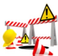
SICUREZZA SUL LAVORO