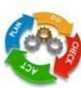
SISTEMI DI GESTIONE