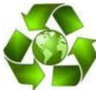
AMBIENTE E TERRITORIO